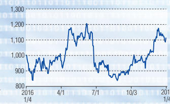
昭和シェル石油 東証1部(5002)