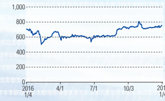
コンテック 東証2部(6639)