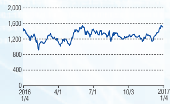
フェローテック 東証JQS(6890)