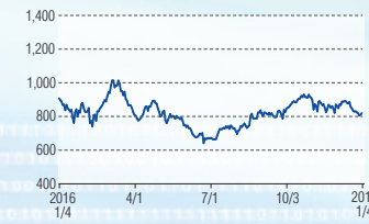
千代田化工建設 東証1部(6366)