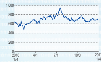
タカラレーベン 東証1部(8897)