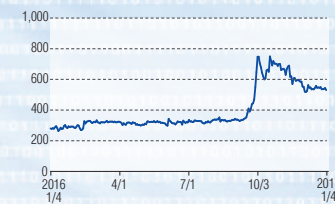
リアルコム マザーズ(3856)