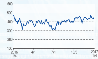
新電元工業 東証1部(6844)