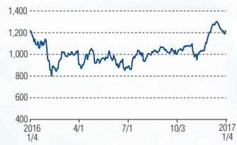
パナソニック 東証1部(6752)