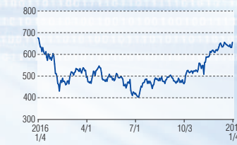
日立製作所 東証1部(6501)