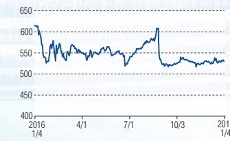
日創プロニティ 福岡Q(3440)