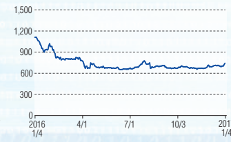
サンコーテクノ 東証2部(3435)