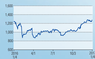
バイテックホールディングス 東証1部(9957)