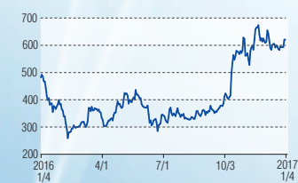
インターアクション 東証2部(7725)