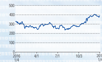
東海カーボン 東証1部(5301)