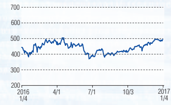
ジーエス・ユアサコーポレーション 東証1部(6674)