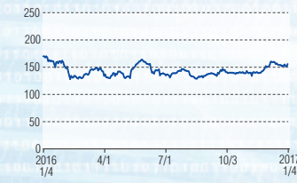
すてきなグループ 東証1部(8089)