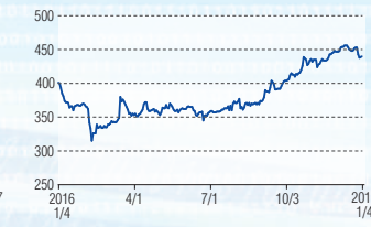
オーナンバ 東証2部(5816)