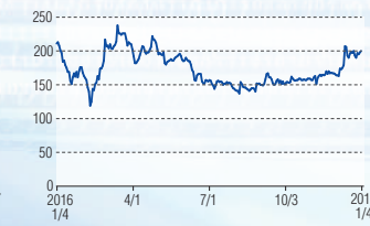
サニックス 東証1部(4651)