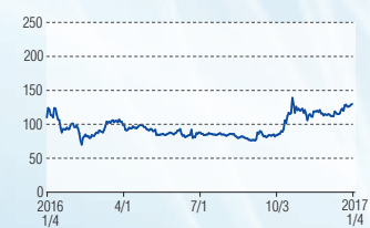
多摩川ホールディングス 東証JQS(6838)