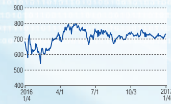
フォーバル 東証1部(8275)