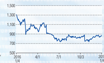
旭ダイヤモンド工業 東証1部(6140)