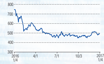
三社電機製作所 東証2部(6882)