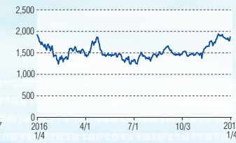
ジェイエフイーホールディングス 東証1部(5411)