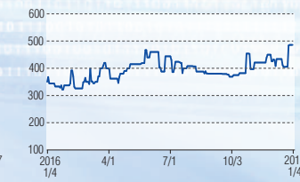
元旦ビューティ工業 東証JQS(5935)