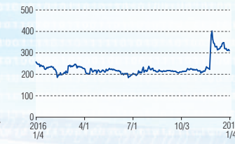
フジプレアム 東証JQS(4237)