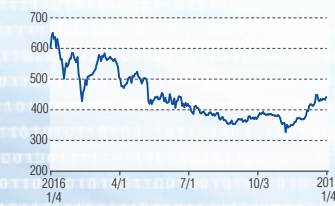
日本アジアグループ 東証1部(3751)