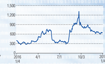
エナリス マザーズ(6079)