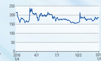
エヌ・ピー・シー マザーズ(6255)